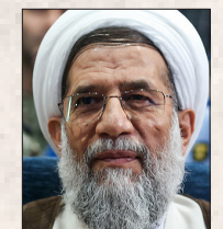
حجت‌الاسلام و المسلمین محمدحسینی رئیس سازمان عقیدتی سیاسی ارتش