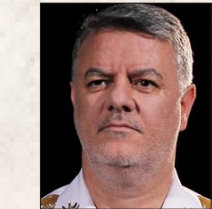
امیر دریادار حسین خانزادی فرمانده نیروی دریایی ارتش