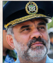
امیر سرتیپ حسن شاه‌صافی فرمانده نیروی هوایی ارتش