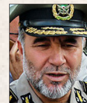
امیر سرتیپ کیومرث حیدری فرمانده نیروی زمینی ارتش