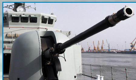
توپ نصب شده بر جماران