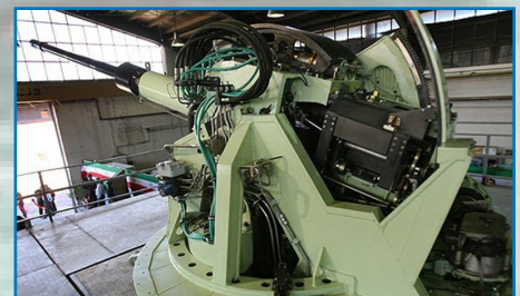
توپ در مراحل آزمایش