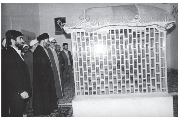
حضور آیت‌الله خامنه‌ای بر مزار شهید مدرس در شهر کاشمر | ۱۳۶۳

این را شما توجه داشته باشید که نظام در یک کارزار عظیمی قرار دارد. اینکه گفتم جای خودمان را بدانیم، مسئله را بشناسیم، اصل مسئله این است: شما در وسط میدان کارزارید، یک کارزار همه‌جانبه‌ی عظیم؛ این کارزار را باید احساس کنید، طرف مقابل را باید بشناسید و این جور، تکلیف همه‌ی ما معین می‌شود. نظام، بدون مشی انقلابی ارزشی ندارد؛ واقعاً ارزشی ندارد. نظام، اگر چنانچه مشی انقلابی نداشته باشد، به آن آرمان‌ها نخواهد رسید، به دنبال آن آرمان‌ها نخواهد بود و با آن رژیم‌های گذشته‌ی کشور هم هیچ تفاوتی نخواهد داشت و ارزشی ندارد. ● ۹۷/۳/۷