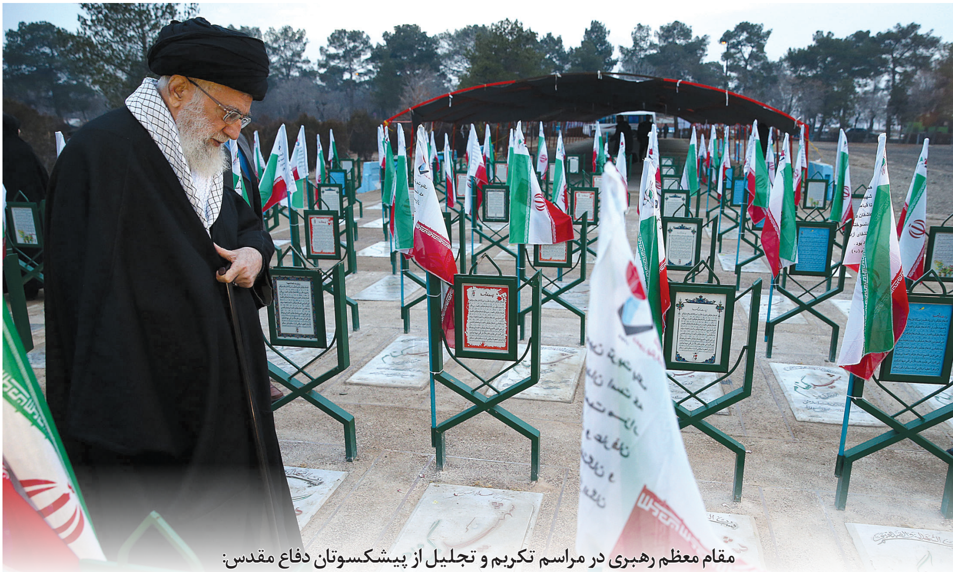
مقام معظم رهبری در مراسم تکریم و تجلیل از پیشکسوتان دفاع مقدس:

معاون رئیس جمهور با بیان اینکه بعد از واقعه عاشورا، جریانی به عظمت دفاع مقدس ما در طول تاریخ سابقه نداشته است، اضافه کرد: امروز افتخار می‌کنیم که ما آرزوی حضور داشتیم اما با این وضع مقدور نشد تا آن‌شاه‌الله آن حضرت عنایت و کمکی بفرمایند.