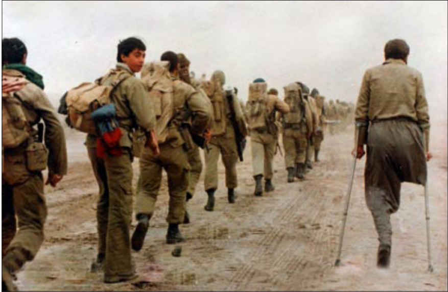
میراث ماندگار دفاع مقدس

به این ترتیب بود که از ۳۱ شهریور با اراده رهبری الهی‌گونه امام خمینی (ره) جوانه جنبش شگفتی‌ساز مقاومت نقش بست و اکنون بعد از قریب ۴ دهه این جوانه‌ها در قامت نهال نیرومندی در خطه خاورمیانه سر برآورد. قریب به اتفاق تحلیلگران در بازخوانی تاریخ دفاع هشت ساله ایرانیان بر این واقعبت انگشت تأکید