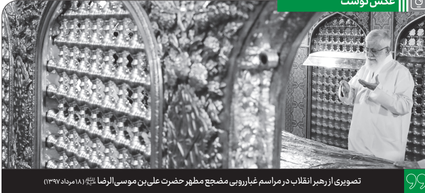
تصویری از رهبر انقلاب در مراسم غبارروبی مضع مطهر حضرت علی بن موسی الرضا (ع) (۱۸ مرداد ۱۳۹۷)