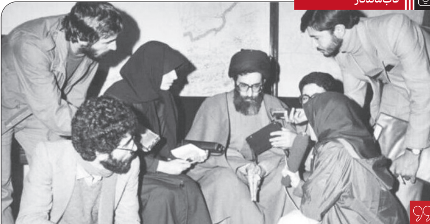
آیت الله خامنه‌ای در جمع خبرنگاران؛ پس از یکی از جلسات شورای عالی دفاع در زمان نمایندگی مجلس