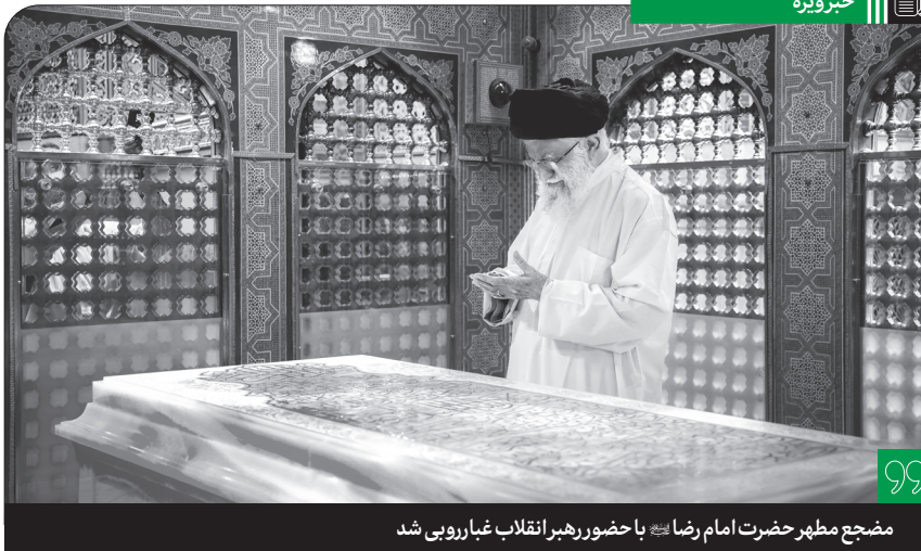
مضحیح مطهر حضرت امام رضا (ع) با حضور رهبر انقلاب غبارروبی شد

همزمان با روزهای آغازین ماه ربیع‌الاول، مراسم غبارروبی ضریح مطهر حرم ثامن الحجج حضرت علی بن موسی‌الرضا علیه‌الآف التحیه والتنا با حضور حضرت آیت‌الله خامنه‌ای، رهبر انقلاب اسلامی، جمعی از علما، تولیت آستان قدس و خادمان آستان مقدس رضوی برگزار شد. در این مراسم سرشار از فضای معنویت و عطر ولایت و امامت مداحان با زمزمه زیارات جامعه کبیره و امین‌الله به ذکر مناقب و مرثی اهل بیت (ع) به مناسبت ایام شهادت امام حسن عسکری (ع) پرداختند و با حضرت رضا (ع) راز و نیاز کردند. به گزارش خط حزب‌الله، در حاشیه این مراسم، حضرت آیت‌الله خامنه‌ای با حضور بر مزار شهید حجت‌الاسلام والمسلمین رئیسی فاتحه قرائت کردند.